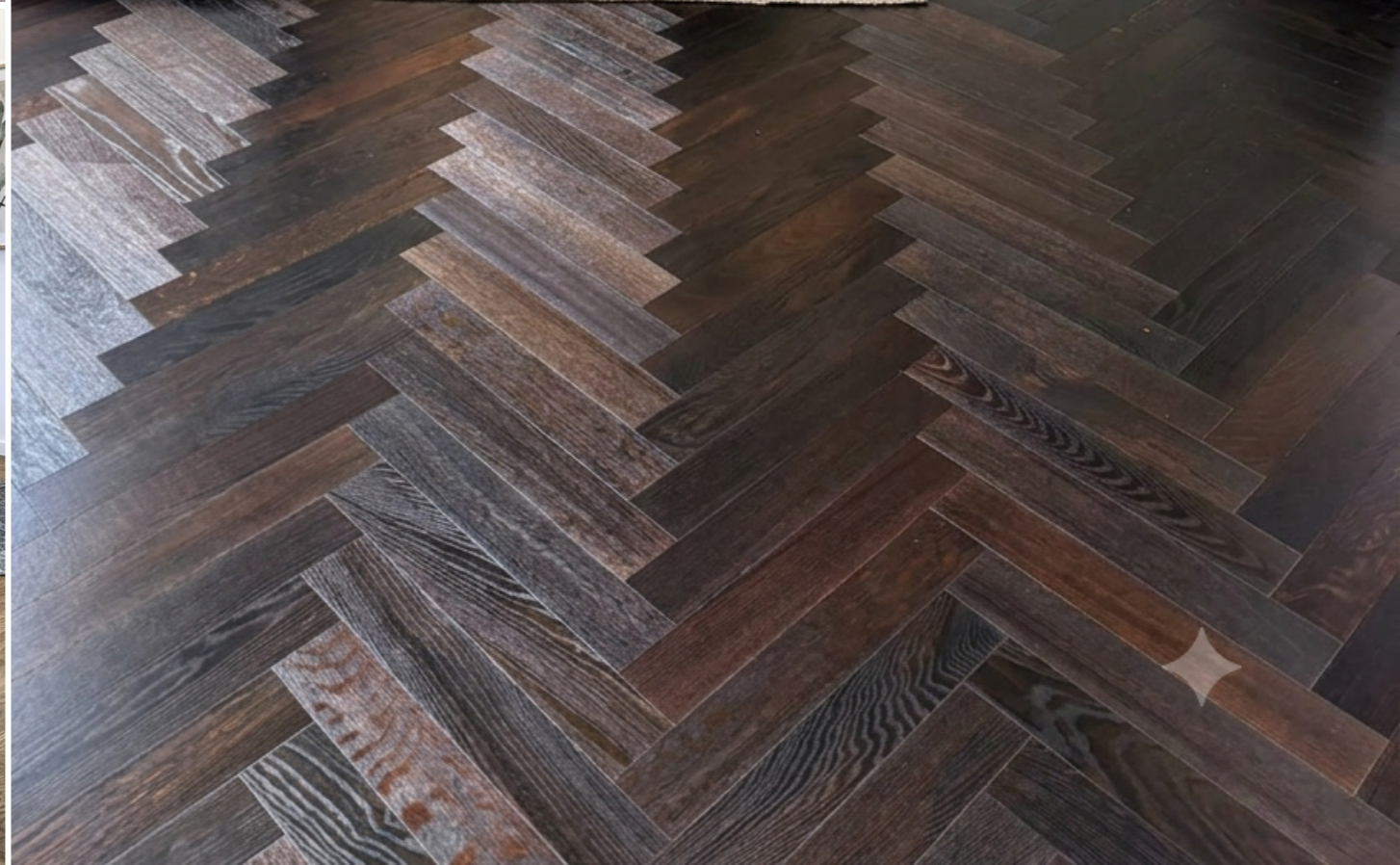
links unten: Duo-Line Eiche Wildstyle oxydativ geölt