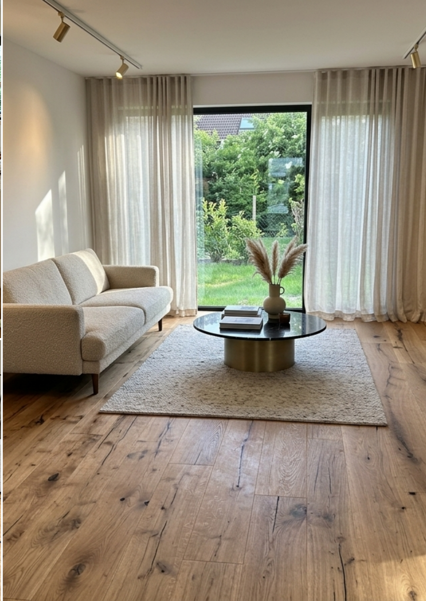
Alle drei Bilder: Amadeus Eiche Origin oxydativ geölt