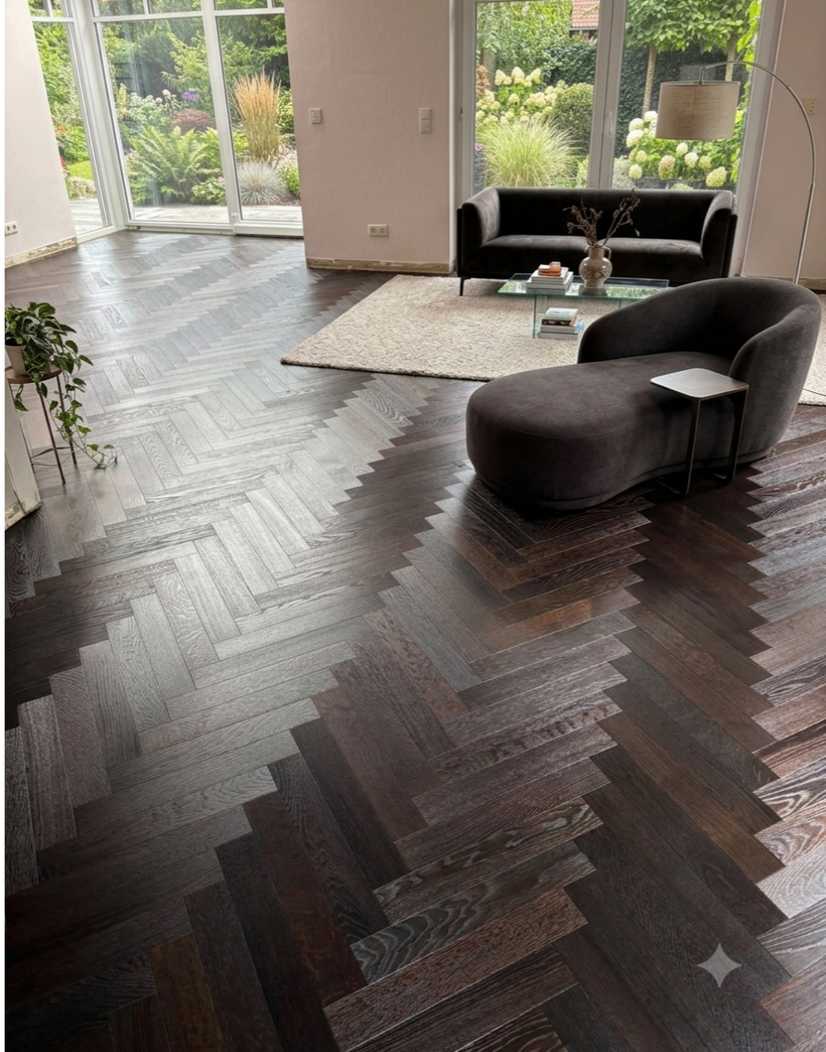
rechts: Top-Line 540 Eiche Antik rundum gefast oxydativ geölt