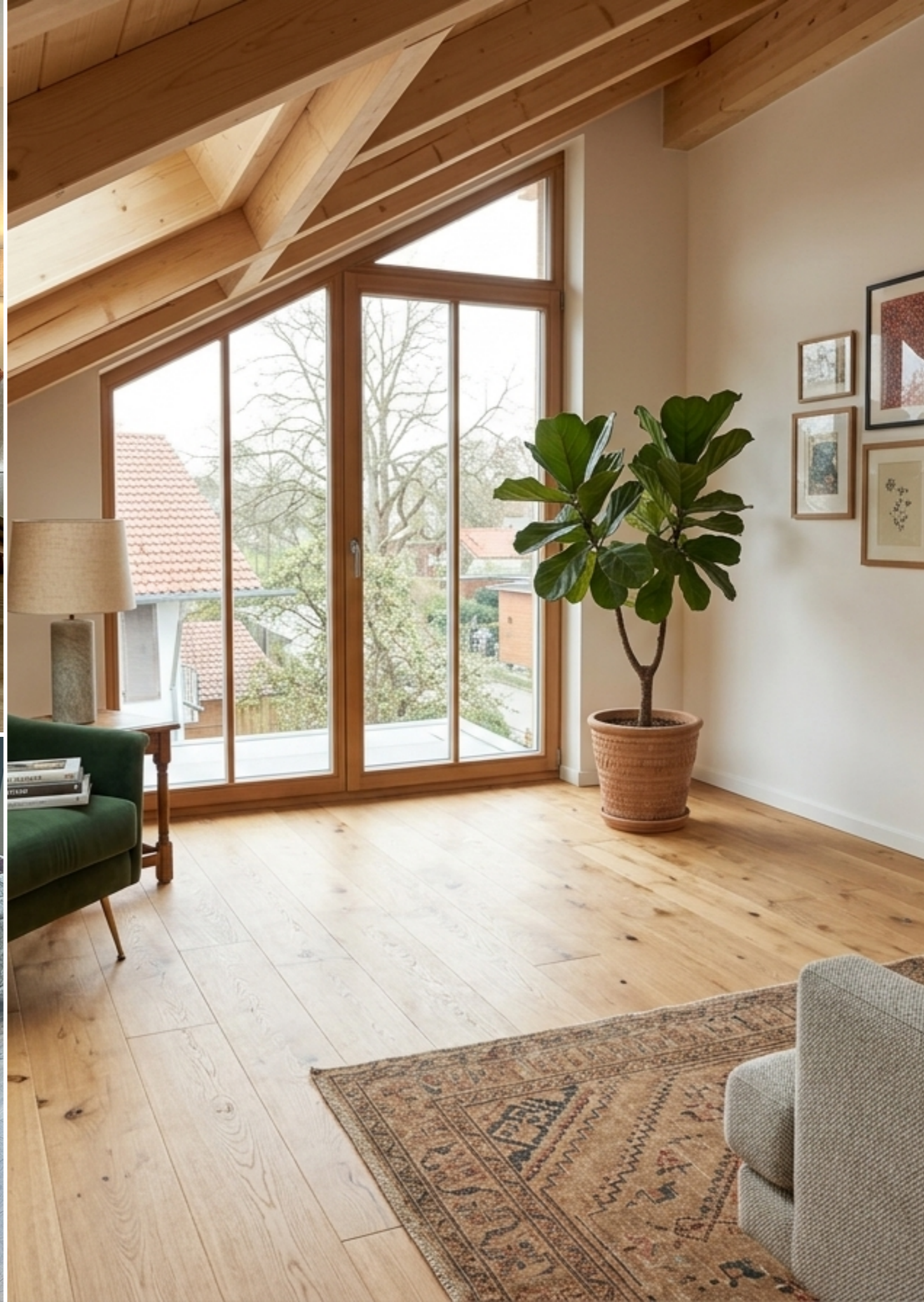
links unten: Amadeus Räuchereiche gebürstet und oxydativ geölt