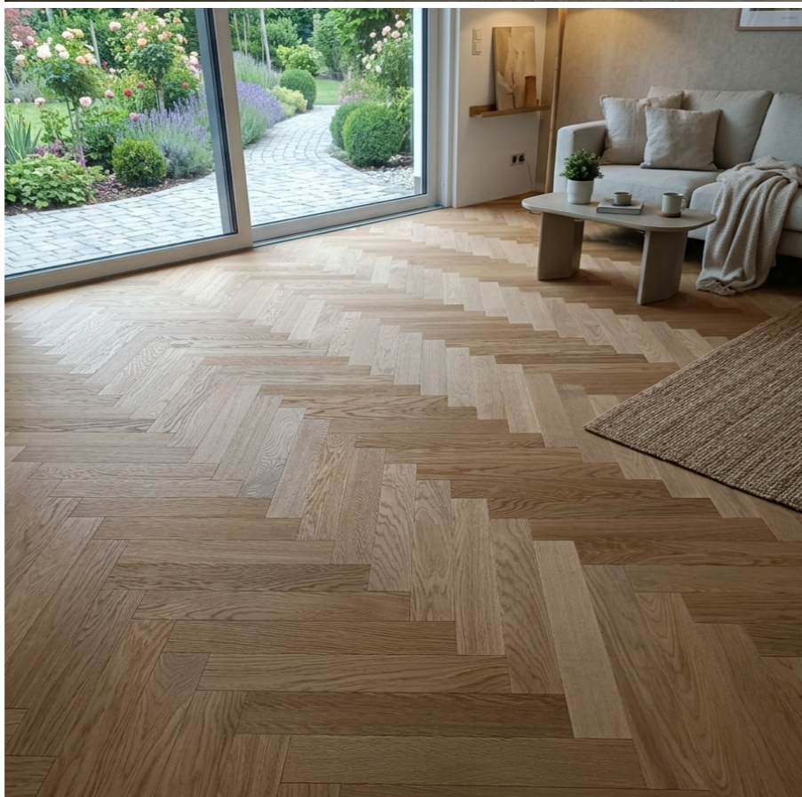
links unten: Top-Line 540 Eiche Natura oxydativ geölt