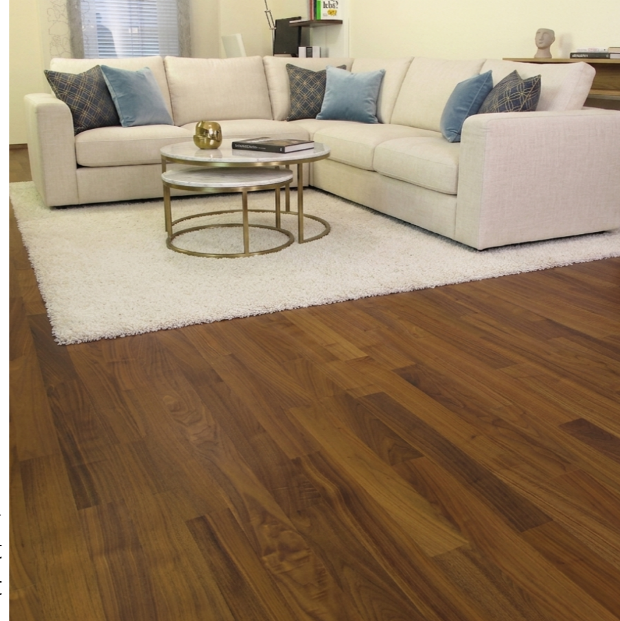
Links und Rechts: Duo-Line Black Walnut seidenmatt versiegelt