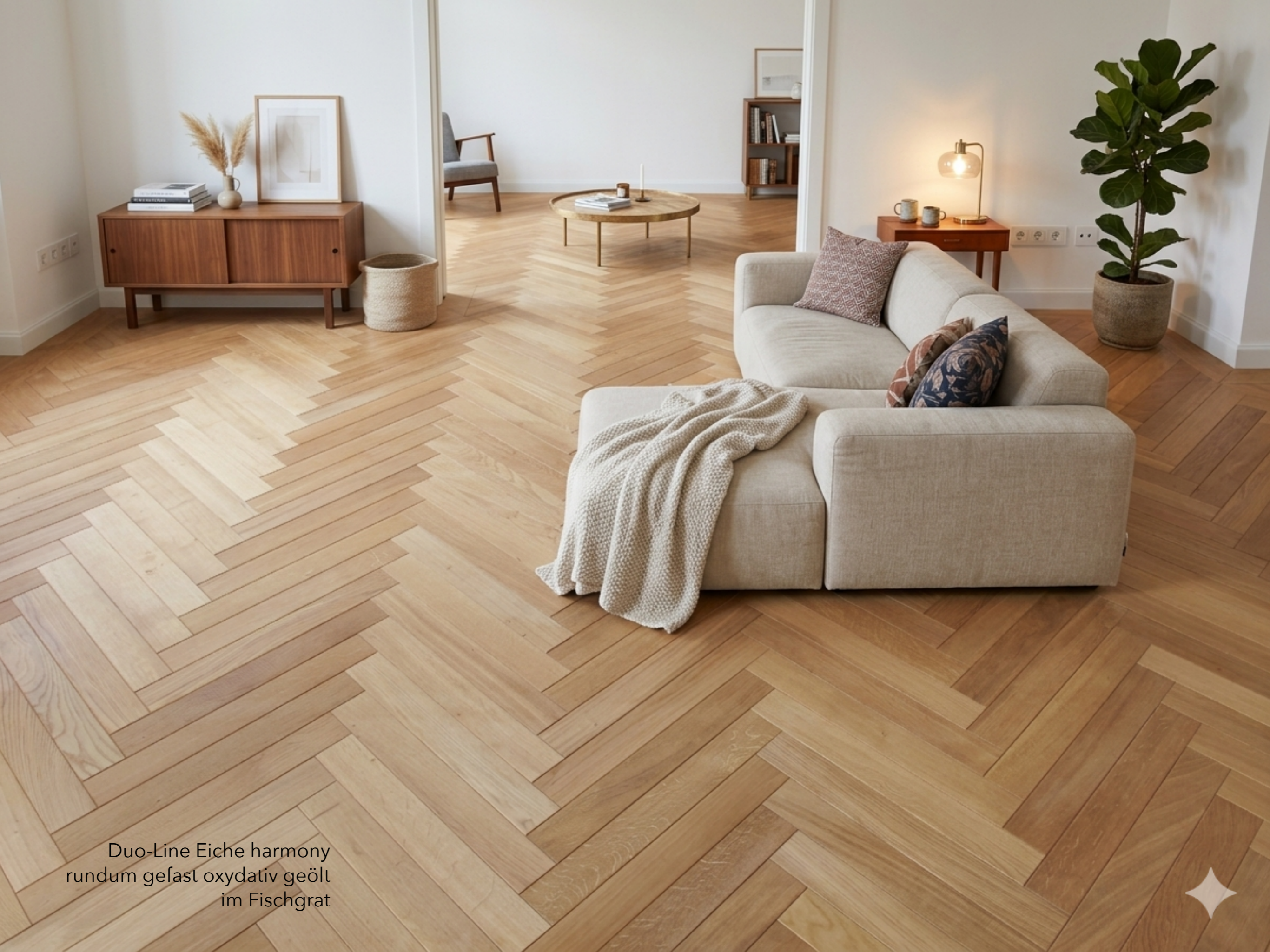
Duo-Line Eiche harmony rundum gefast oxydativ geölt im Fischgrat