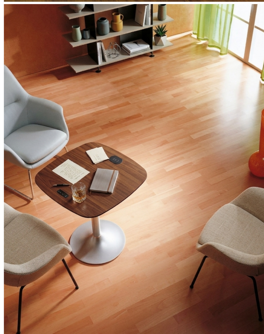
Rechts: Duo-Line Eiche Klassik oxydativ geölt